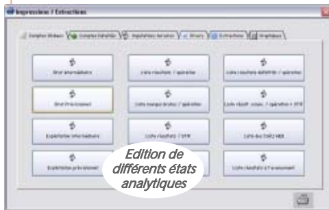
Edition de différents états analytiques